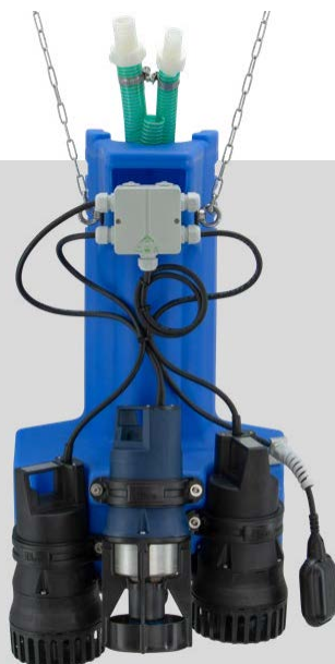
AQUAMAX® CLASSIC Z 1-16