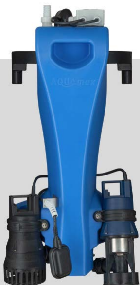
AQUAMAX® BASIC 1-16