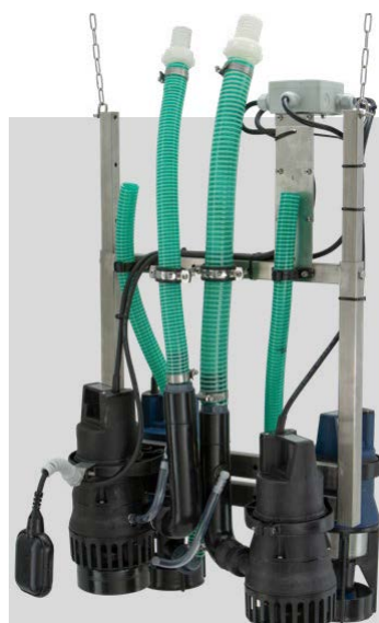
AQUAMAX® CLASSIC Z 17-50